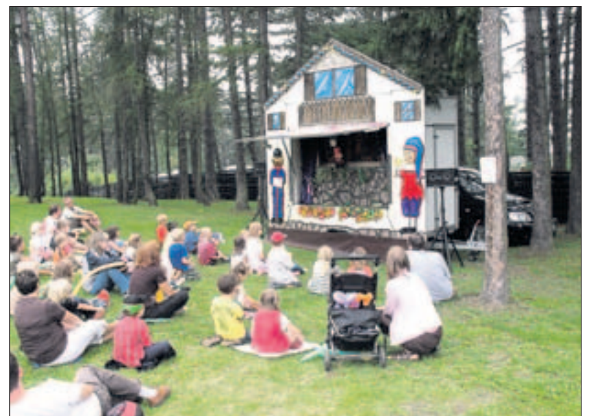
Das Kasperletheater der Laubinger Puppenbühne war wieder beliebter Anziehungspunkt für die jungen Gäste.

Die meiste Arbeit lag wie immer in den Händen der Mitarbeiterinnen und Mitarbeiter, denen es wieder gelungen war, ein zünftiges Fest auf die Beine zu stellen. Jung und Alt konnten sich wohlfühlen. Die Verbindung zwischen Flugtag und Sommerfest Elisabethstift bewährt sich jedes Jahr. Die Menschen kommen in Scharen zum Schäferstuhl.